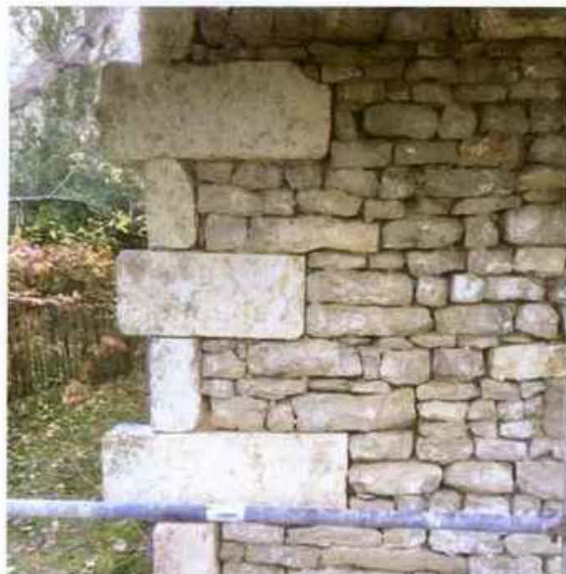
Changement de pierres d'angle en façade.