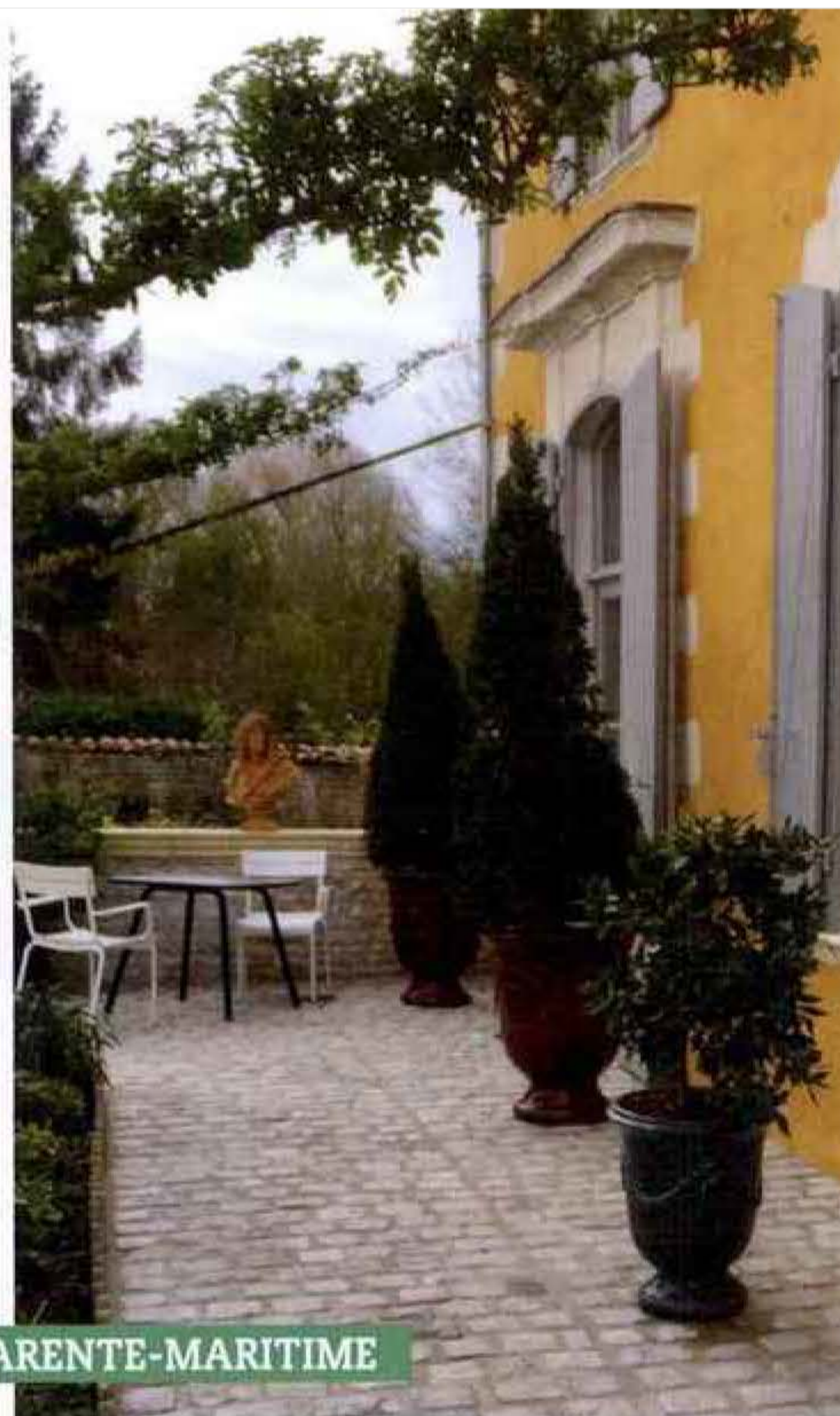
Enduit et badigeon ocre, terrasse pavée.

« Nous tenons à ce que notre maison soit refaite avec un grand respect de son histoire, ainsi que des matériaux et techniques traditionnels ! Comment pourrais-je faire autrement, alors que je milite aussi dans une association de défense du patrimoine local : Nieul Authentique ? »